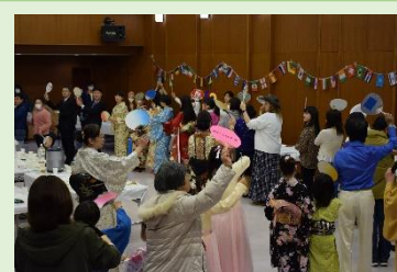
New Year Party!