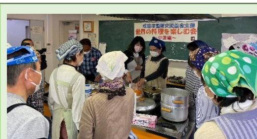
世界の料理を楽しむ会