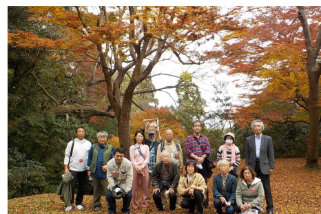
紅葉の佐倉城址公園を散策