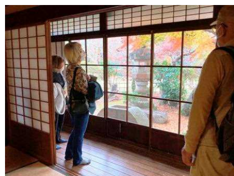
錦秋の堀田邸を見学