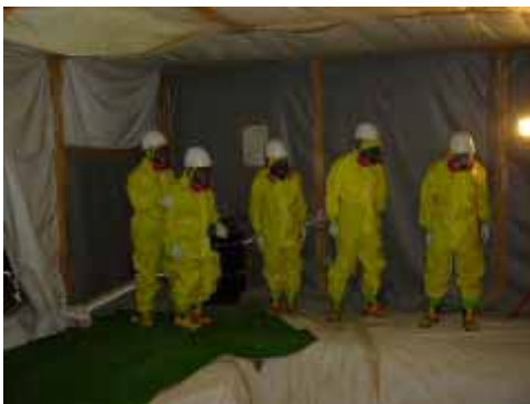
松下電器でPCB廃棄物処理の調査

安心して暮らせるのは、平和があるからです。憲法9条が世界遺産になることを願い、世界の人々と手をつなぎながら、平和をめざす活動を続けます。