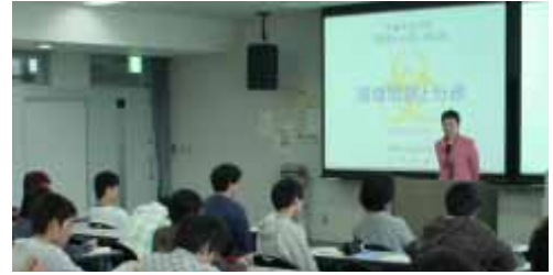
大阪市大・立命館大などで講義