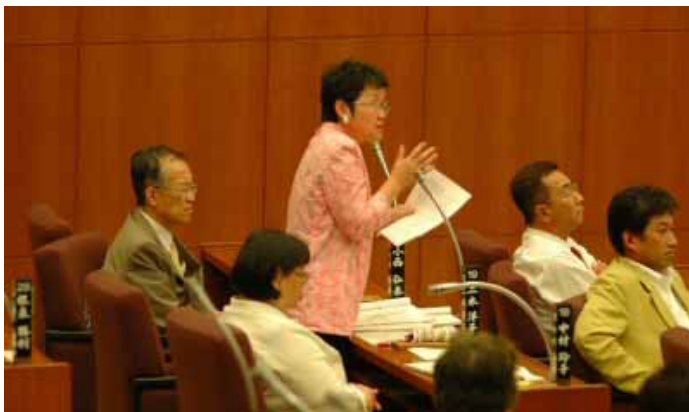
本会議で厳しく追及

市役所を仕事と子育てが両立できるモデル職場に(05.3) 審議会答申から大幅に後退した男女共同参画推進条例(05.12) 苦情処理制度については市民にわかりやすい広報を(06.3)